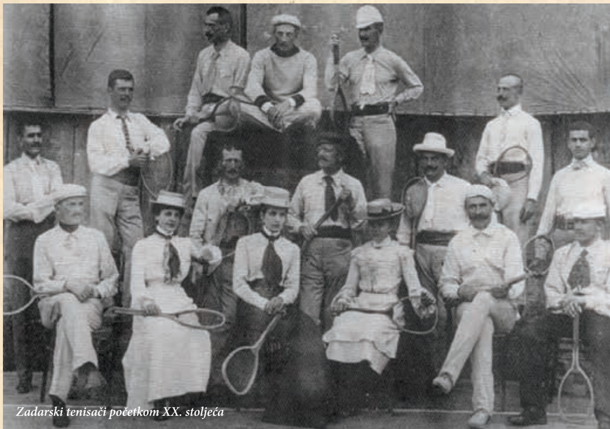
Zadarski tenisači početkom XX. stoljeća

Na predjelu zvanom Ravnice (blizu dvorane na Jazinama) nogomet je igralo 50 časnika naizmjenično, podijeljenih u dvije momčadi. Tom prigodom svirane su himne Velike Britanije i Austro-Ugarske monarhije. Osim vojvode od Edinburgha i njegove supruge Marine (kći ruskog cara