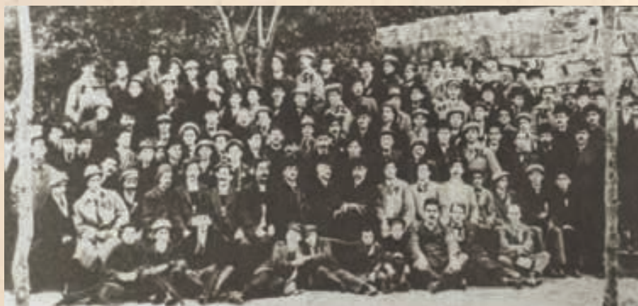
Nogometno igralište na Pazarò al Merchetto u Zadru gdje je održano prvo nogometno prvenstvo za Dalmaciju 26. prosinca 1910.

Aleksandra II.) tu su se nalazili i princ Georg od Walleša, princ Ludvig od Battenberga, markiz od Lome, zet kraljice Viktorije, te brojni časnici britanske mornarice i njihove dame. Njihov posjet Zadru trajao je 3 dana, za koje vrijeme su posjetili Carsko namjesništvo, općinu i širu okolicu grada. Priređeni su im razni koncerti i plesovi, a grad je bio svečano ukrašen i osvjtljen.